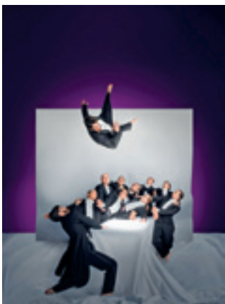
Kuva: HKT, Silence, kuva Petra Tiifonen

on Kinetic Orchestra tanssiryhmän perustaja ja taiteellinen johtaja. Mandelinin edellistä teosta ( Gravity ) esitettiin teatterin ohjelmistossa poikkeuksellisesti kaksi kautta 2021 ja 2023 loppuunmyydyille katsomoille.