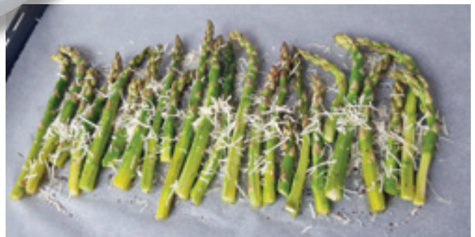
Parsat ennen uuniin laittoa.

Poista parsoista kova tyviosa ja kuori parsat nupusta alaspäin. Laita parsat uunipellille, ripottele päälle oliiviöljyä, suolaa ja sitruunanmehua, rouhi pinnalle mustapippuria myllystä, raasta parmesaania ja sekoittele hieman.