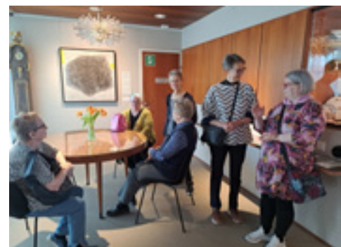
Helmerit vierailivat huhtikuussa Didrichsenin upeassa taidemuseossa Helsingin Kuusisaarella.